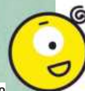
Funégo Etre intelligent avec moi-même