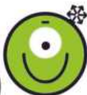
Multifun Etre intelligent avec les autres