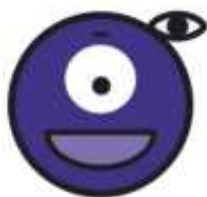
3Dfun Etre intelligent avec ce que je vois