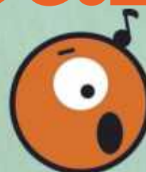
Mélofun Etre intelligent avec la musique et les sons