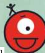
Bodyfun Etre intelligent avec mon corps