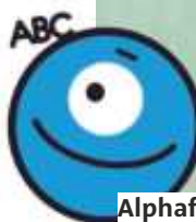
Alphafun Etre intelligent avec les mots